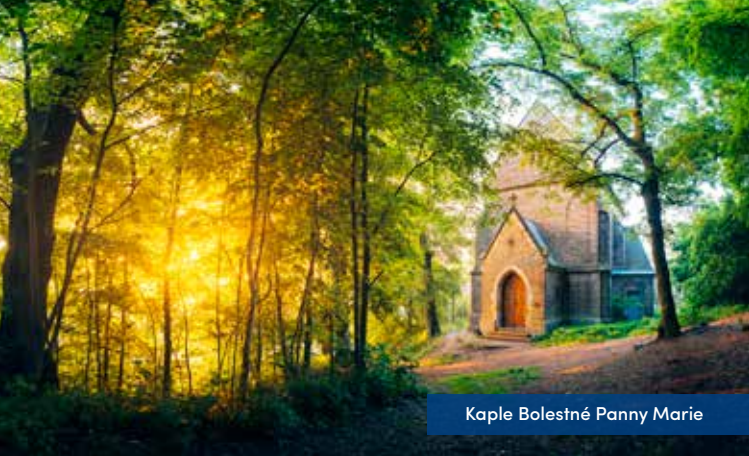
Kaple Bolestné Panny Marie