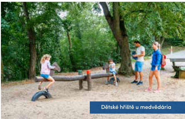
Dětské hřiště u medvědária