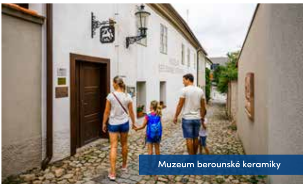
Muzeum berounské keramiky

Milovníky kultury, památek a historie provede trasa centrem Berouna, které je chráněnou městskou památkovou zónou. Jsou zde historické veřejné budovy jako radnice, kostel, fara a měšťanské domy s výraznými štíty. Návštěvníky zaujmou i přilehlé uličky středověkého rázu, který je patrný do dnešních dnů.