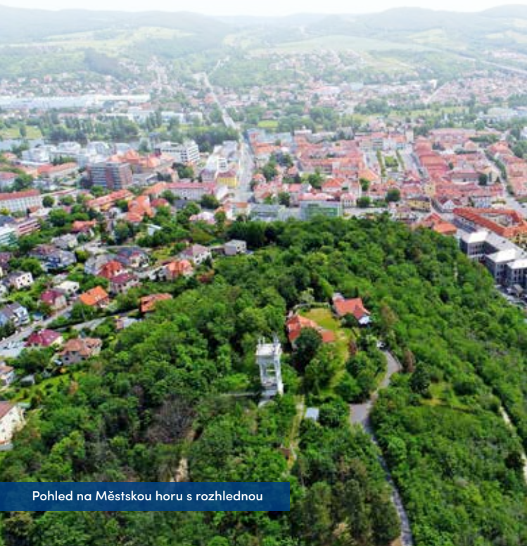
Pohled na Městskou horu s rozhlednou

Městská hora je přírodní dominantou centra Berouna a slouží pro odpočinek, procházky i sport nejen berounským obyvatelům od 80. let 19. století, kdy byl založen Okrašlovací spolek v Berouně. Jeho první akcí byla právě parková úprava Městské hory, při níž vznikly pěšiny, byly vysazeny stromy a rozmístěny první lavičky. V klidném prostředí lesoparku jsou dnes také dětská hřiště pro malé i velké děti, medvědárium, rozhledna a občerstvení. Stánek s nabídkou nápojů, drobného občerstvení a suvenýrů se nachází hned vedle medvědária.