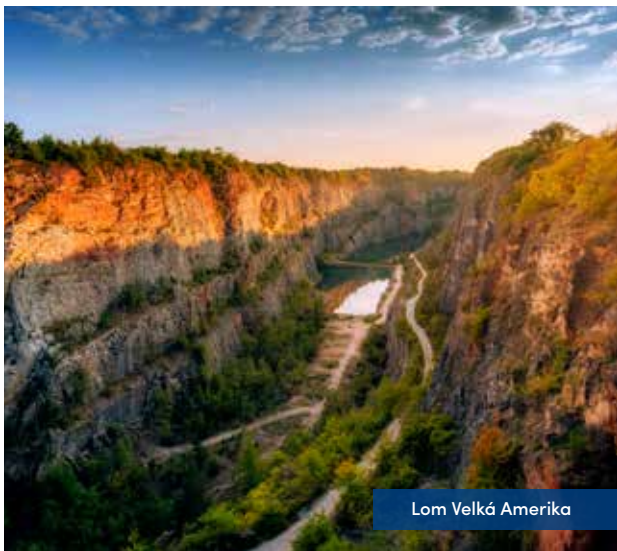
Lom Velká Amerika

Kdo by neznal český Grand Canyon, který poskytl kulisy pro řadu českých i zahraničních filmů? Stejně průzračně modrá voda, která poskytuje domov chráněným organismům, je i v nedalekém lomu Malá Amerika a Mexiko.