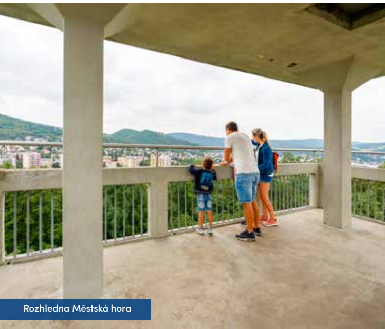
Rozhledna Městská hora